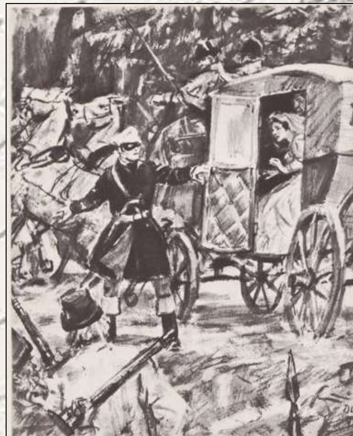
Б.М.Кустодиев. Нападение на свадебный поезд. 1919 г.