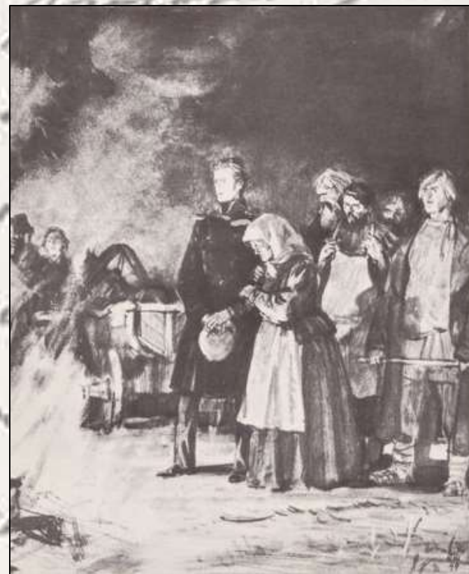
Д.А.Шмаринов. Пожар в Кистенёвке