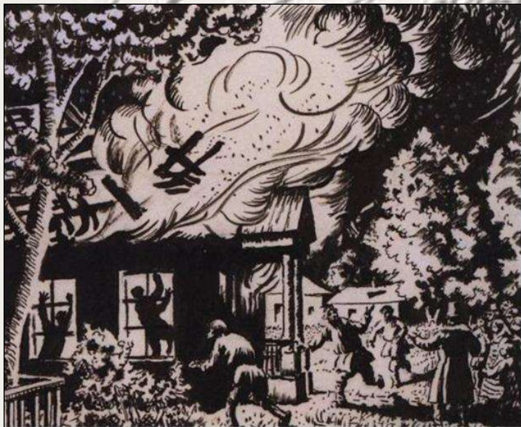
Б.М.Кустодиев. Пожар. 1919 г.