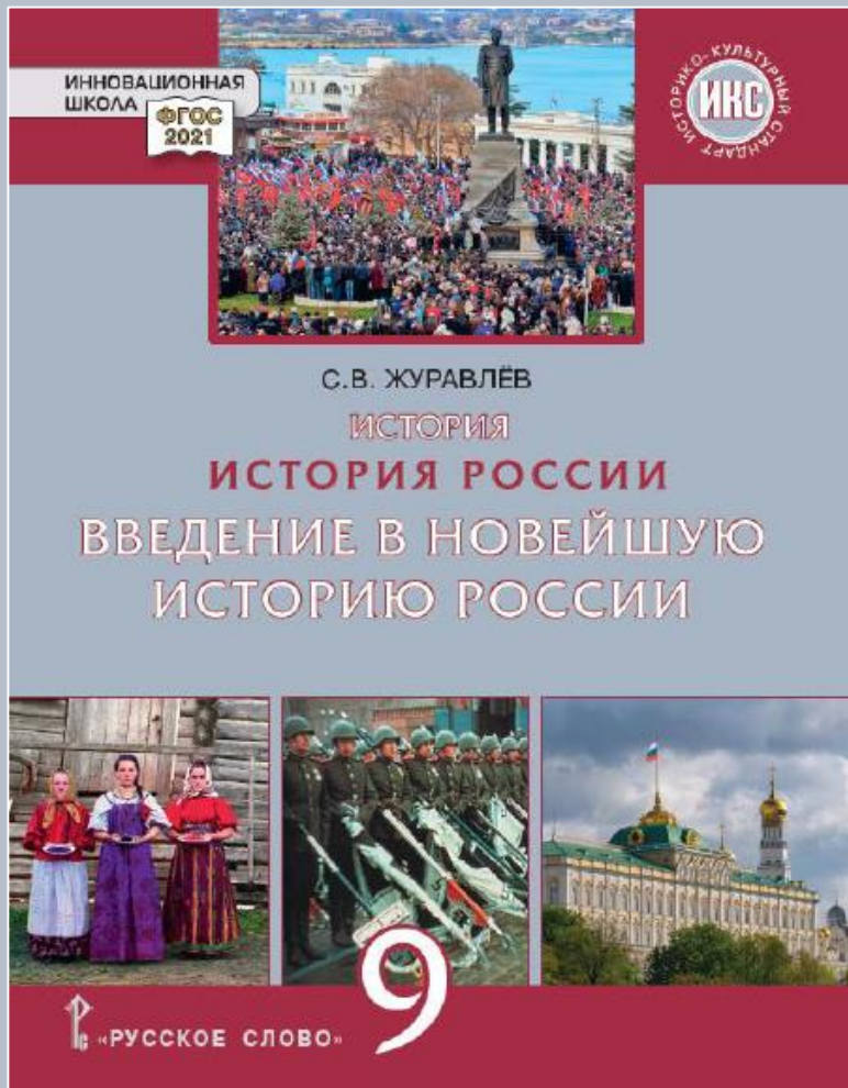
Реализация модуля в курсе «История России» 9 класса