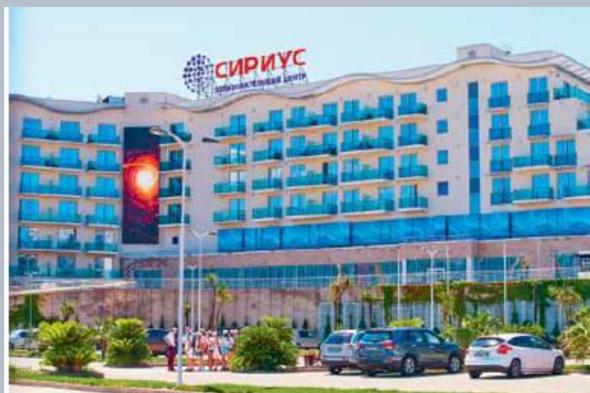
Образовательный центр «Сириус»