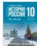
МТ ЕУИ ИР 10 класс...ода.pdf