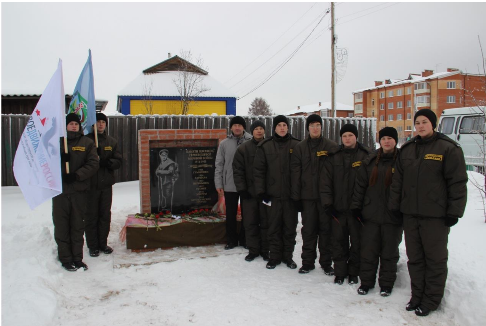
На открытии памятника землякам – участникам Первой мировой войны. 7 ноября 2018 г.