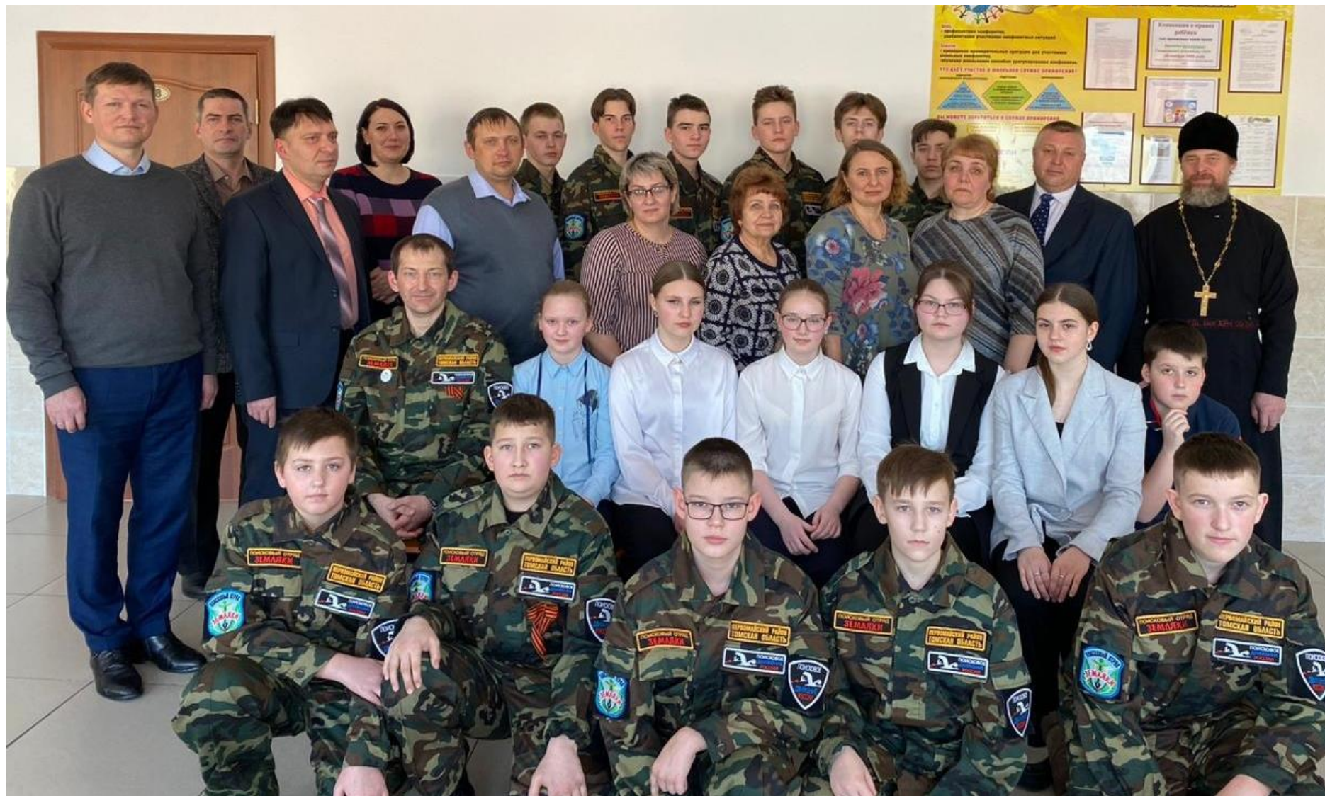
Участники организационного собрания по проекту «Зачулымские герои» в Первомайском районе. 10 февраля 2023 г.