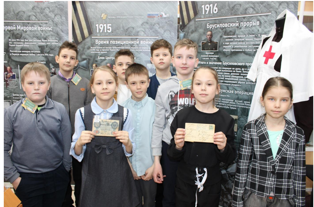
Экскурсии в музее. Экспозиция, посвященная Первой мировой войне. Май 2023 г.