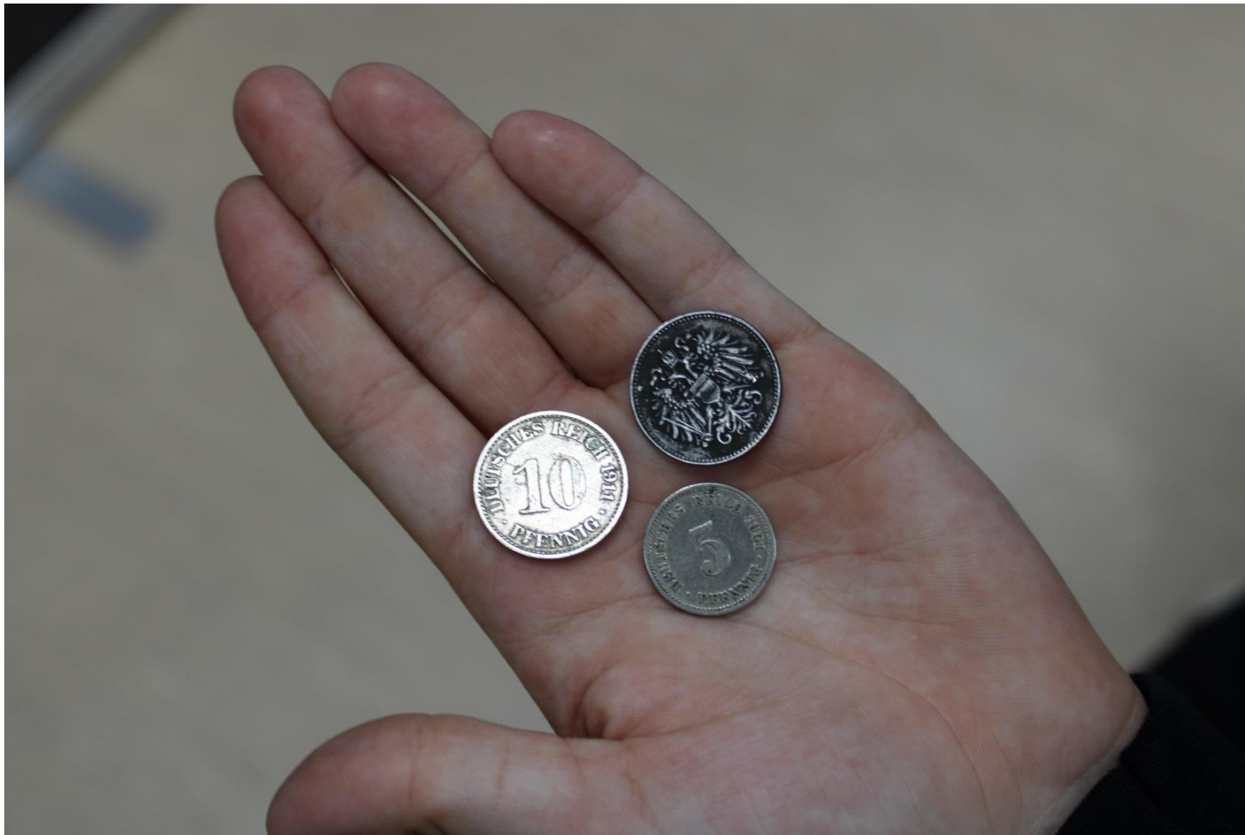
Монеты Германской а Австро-Венгерской империй.