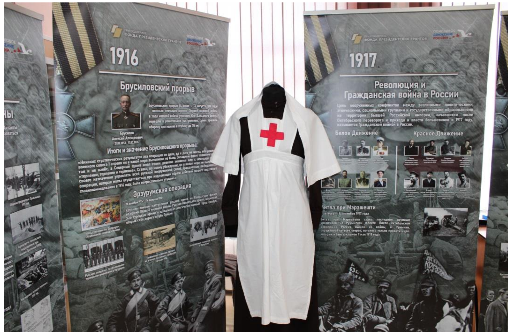
Форма и мобильные стенды.