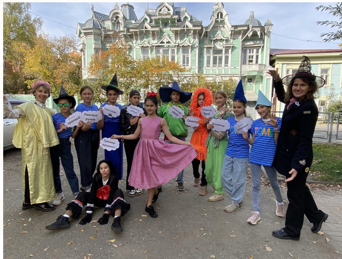
Команда «Изумруды Томи»

I. Командообразование – креативное фото команды