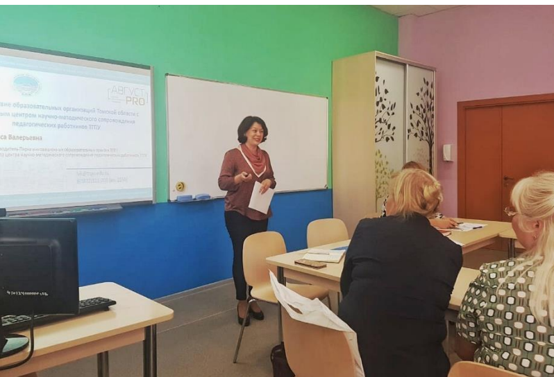
ТОИПКРО. Семинар по методическому сопровождению педагогов Томской области