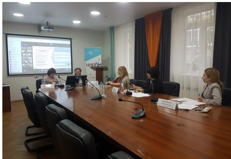
Коллегия Департамента ОО ТО по вопросам региональной системы НМС ПР системы общего образования Томской области