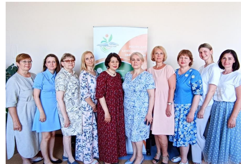
Рабочая встреча с МАУ ЗТО Северск «Ресурсный центр образования»