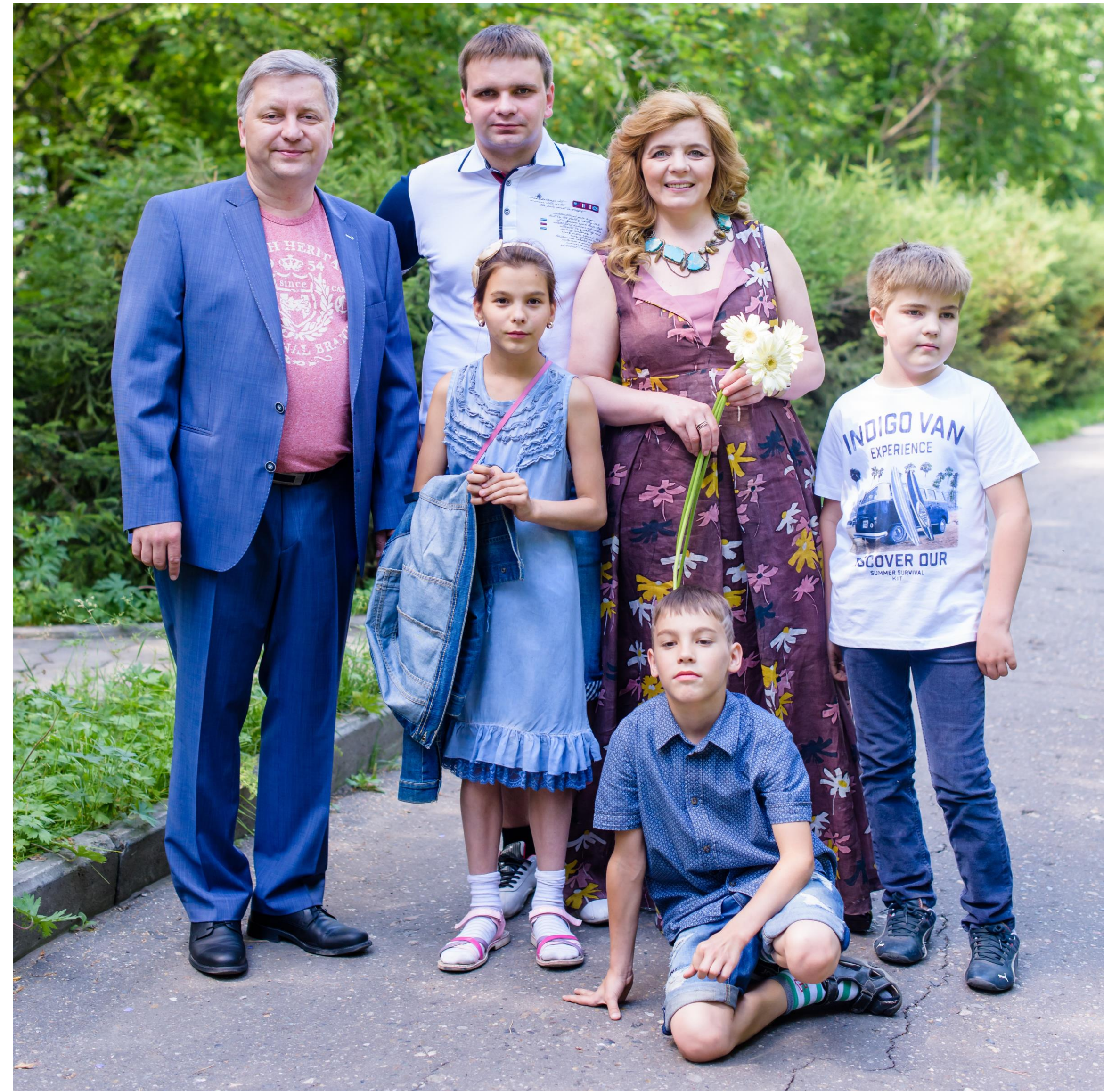
Мама 4х детей