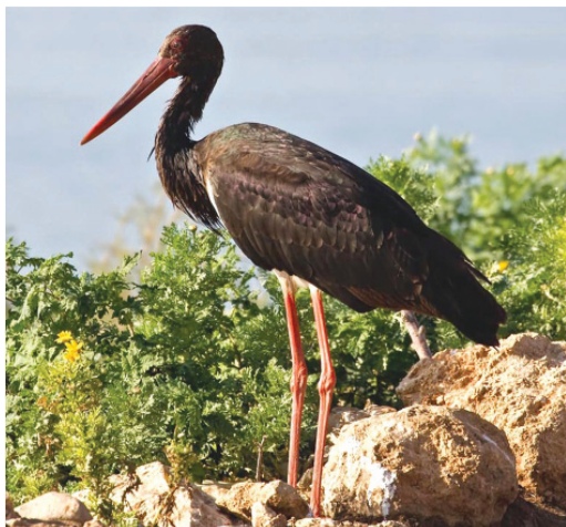
Чёрный аист www.naturelight.ru