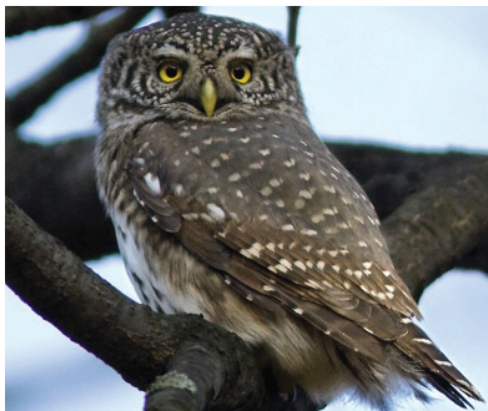
Воробьиный сыч