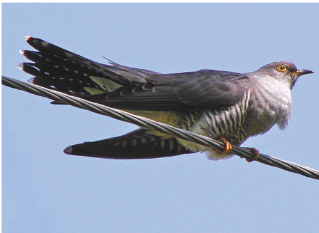
Обыкновенная кукушка www.nature.baikal.ru