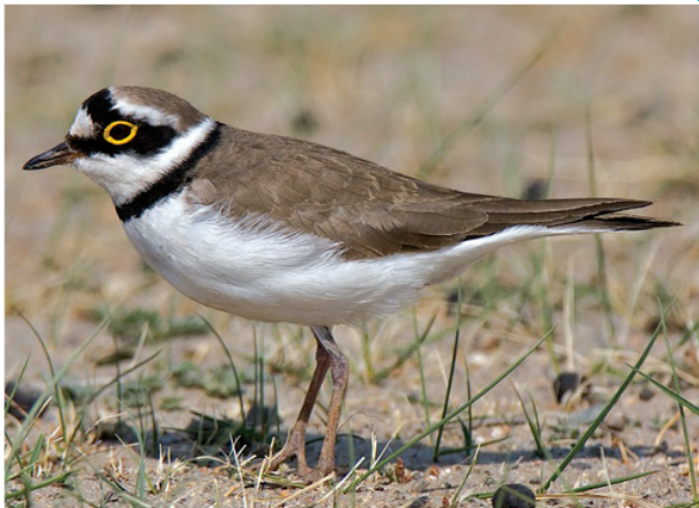
Малый зуек