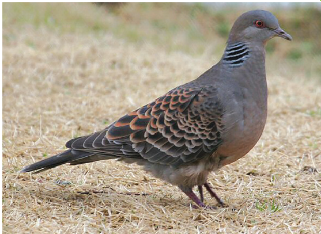
Большая горлица