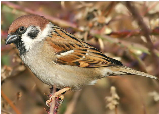
Полевой воробей