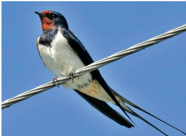
Деревенская ласточка www.live4fun.ru