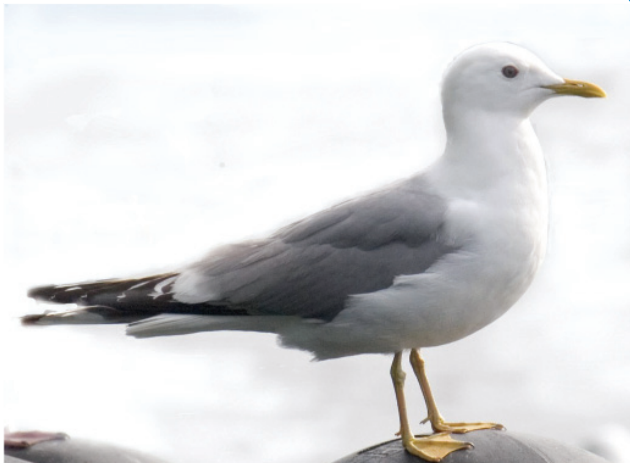
Сизая чайка