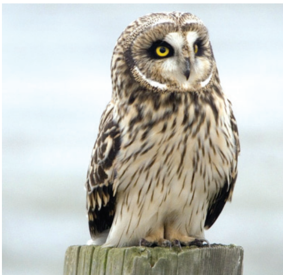
Болотная сова www.tolweb.org