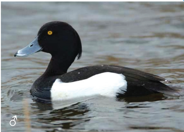
Хохлатая чернеть