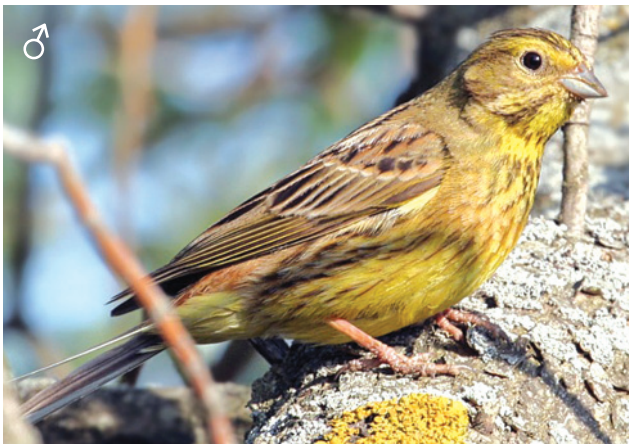
Обыкновенная овсянка