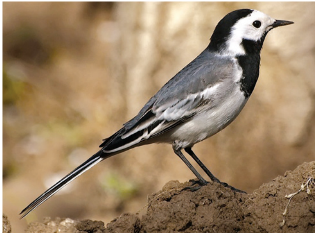
Белая трясогузка