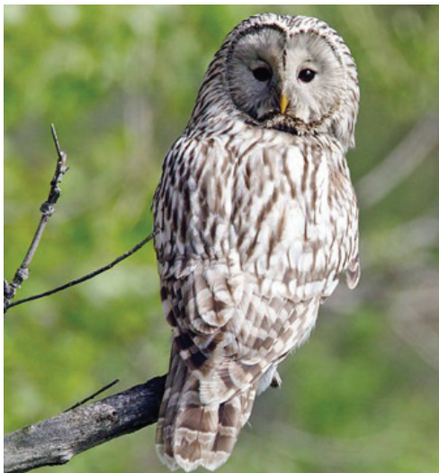
Длиннохвостая неясыть www.ergaki-park.ru