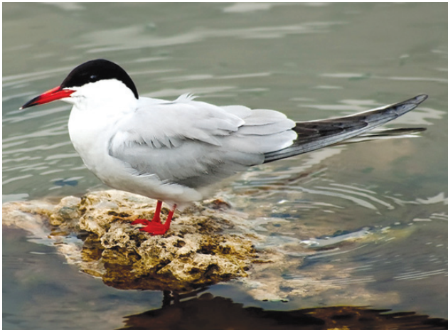
Речная крачка