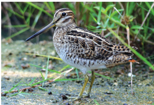
Лесной дупель