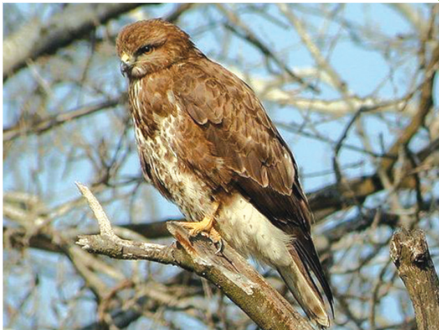
Обыкновенный канюк