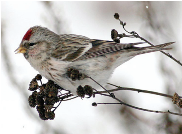
Обыкновенная чечетка