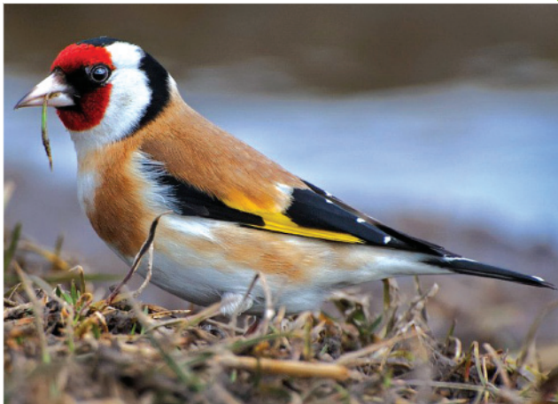
Черноголовый щегол