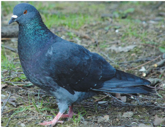
Сизый голубь