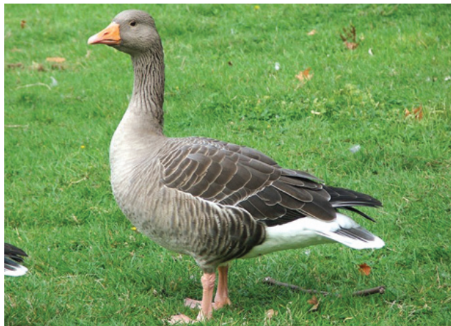
Серый гусь www.logovo.info