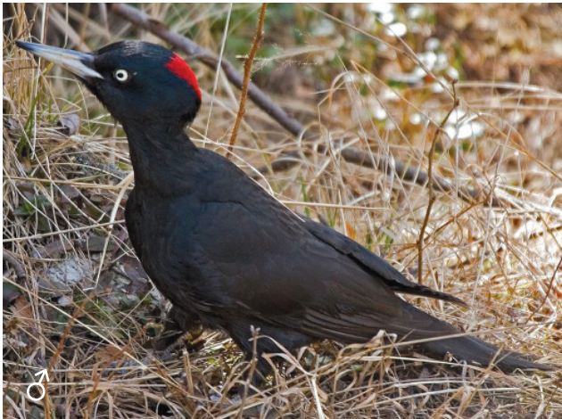
Черный дятел