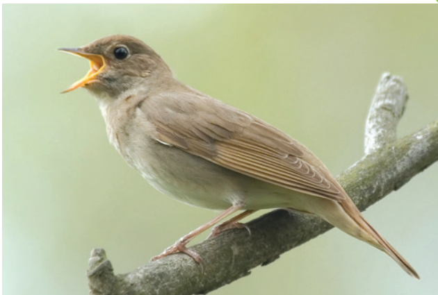
Обыкновенный, или Восточный, соловей