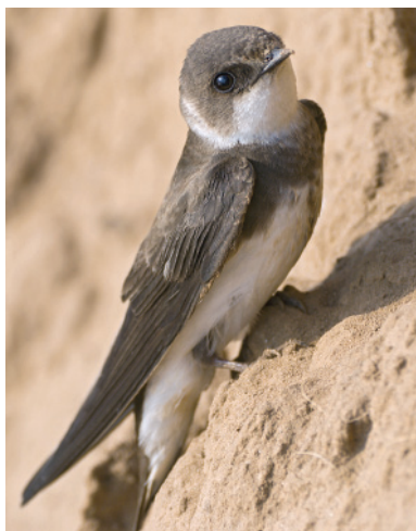
Береговая ласточка www.club.foto.ru