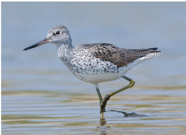
Большой улит