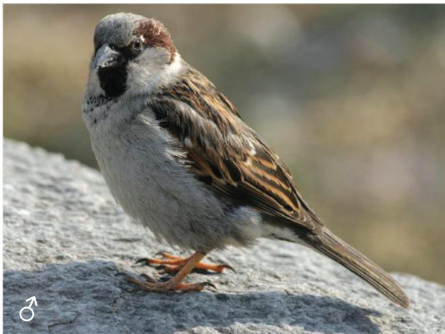
Домовый воробей www.zoology.edu.ru