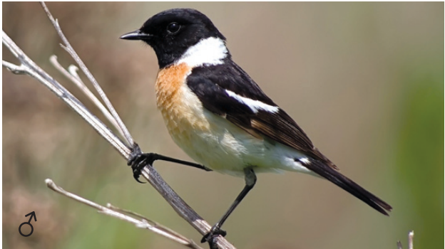
Черноголовый чекан