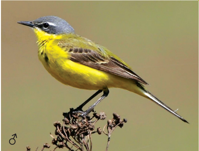
Желтая трясогузка www.birdsmaryno.msk.ru